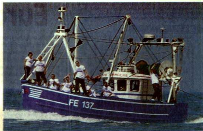
De Bredense Bruinvissen bouwden na hun Kanaalovertocht al een feestje op hun geleidende boot. I.V.

” Midden in de zee, in het pikdonker zwemmen tussen immense tankers. Op dat ogenblik voel je je wel heel erg klein